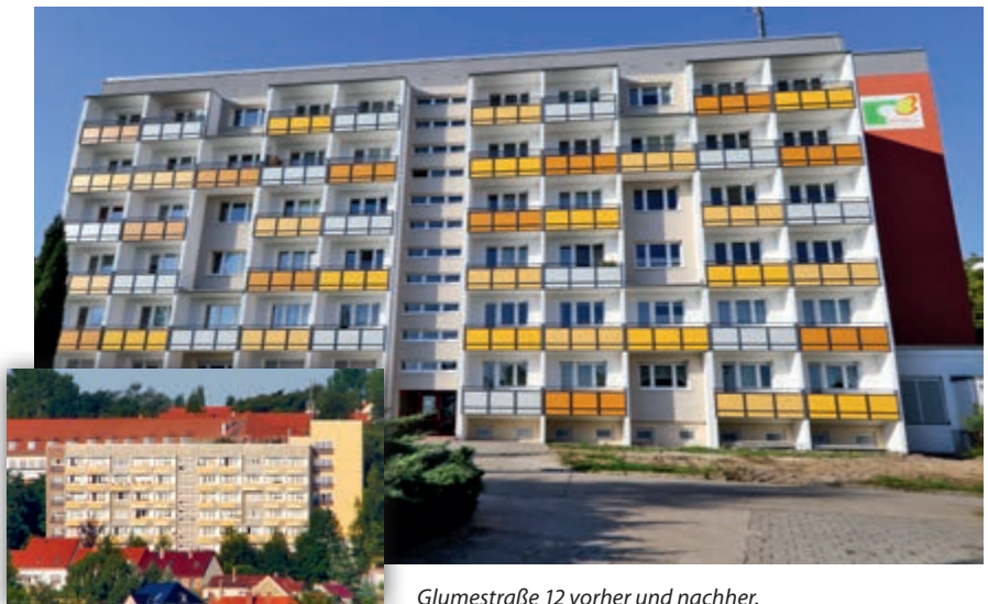
Glumestraße 12 vorher und nachher.

Alles gute Gründe, um auch im nächsten Jahr mit den Arbeiten fortzufahren. Geplant ist in 2016 die Sanierung der Fassaden an mehreren Gebäuden in der Katharinenstraße und auch in der Ferdinand-Neißer-Straße. Der Beginn der Maßnahmen ist im Frühjahr vorgesehen. Über unsere Internetseite und facebook werden wir Sie über die ausgewählten Farbkonzepte und die genauen Termine informieren.