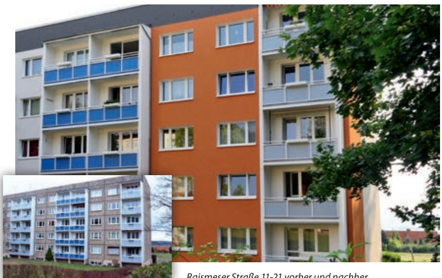
Raismeser Straße 11-21 vorher und nachher.