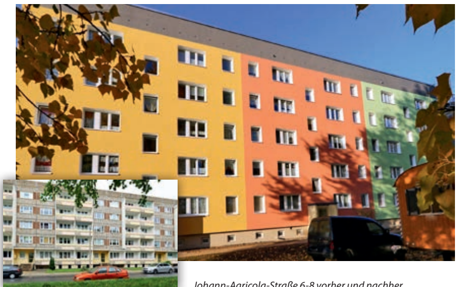
Johann-Agricola-Straße 6-8 vorher und nachher.