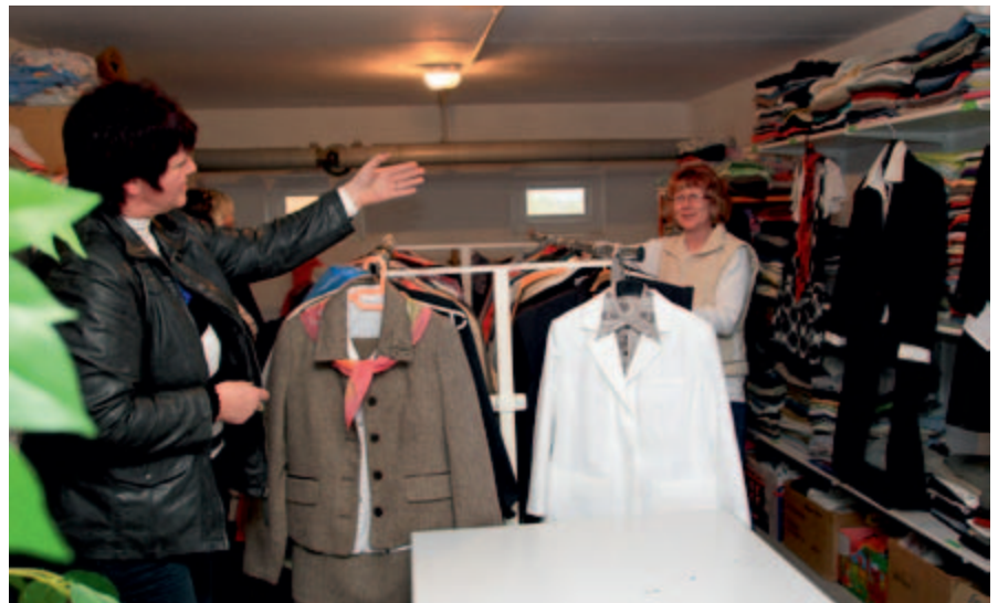
Die Kleiderkammer hat ein großes Bekleidungsangebot.

Nachdem die bisherigen Räumlichkeiten der Kleiderkammer in der Karl-Fischer-Straße kurzfristig freigeräumt werden mussten, suchte die Gesellschaft für Sanierung und Gesamtstrukturentwicklung Mansfelder Land mbH nach einem neuen Standort (die MZ berichtete). Die WOBAU konnte helfen. Im Kellergeschoss der Kurt-Wein-Straße 9 wurden für das Betreiben des „sozialen Kleiderstübchens“ frisch sanierte Räume zur Verfügung gestellt.