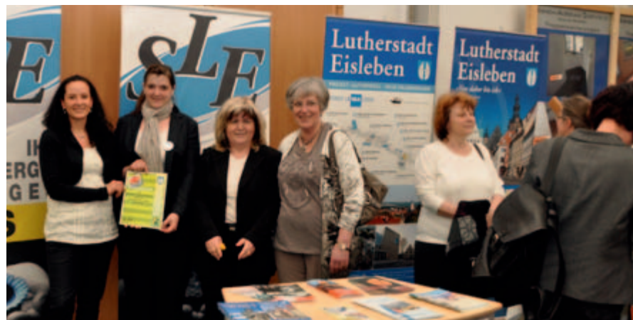
Gemeinschaftsstand der Stadtverwaltung, Stadtwerke und Wobau.

Erstmalig wurde parallel zur Reforma am 28. April ein Sondervermietungstag veranstaltet. Damit konnten wir unseren Messebesuchern die Möglichkeit bieten, nach einer ausführlichen Beratung auf der Reforma die betreffenden Wohnungen sofort zu besichtigen.