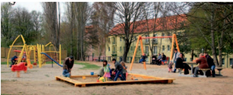
Der neue Spielplatz ist gut besucht.

Aus Kostengründen werden vielerorts Kinderspielplätze vernachlässigt oder verschwinden sogar vollständig aus den Wohngebieten. Unsere Gesellschaft bemüht sich seit Jahren, auch für unsere kleinen Mieter ein interessantes und abwechslungsreiches Wohnumfeld zu schaffen. Mit der Übernahme des städtischen Spielplatzes im Bereich der Johann-Agri-